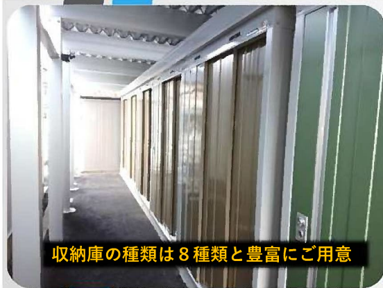
収納庫の種類は8種類と豊富にご用意