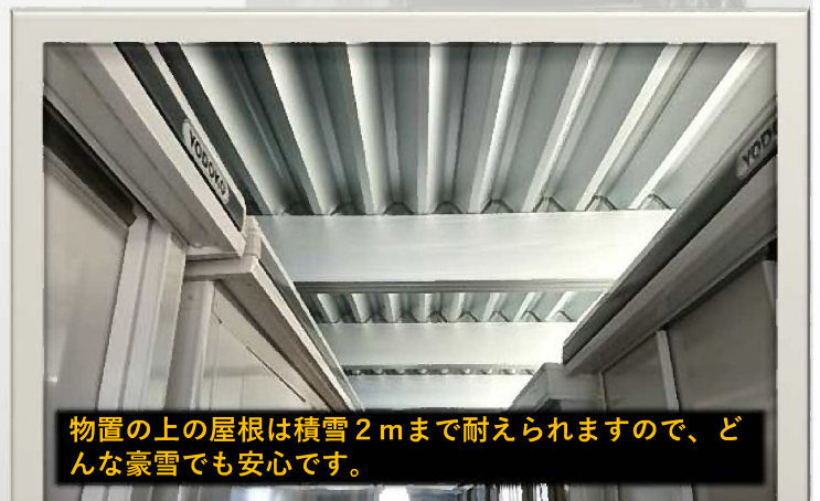
物置の上の屋根は積雪2mまで耐えられますので、どんな豪雪でも安心です。