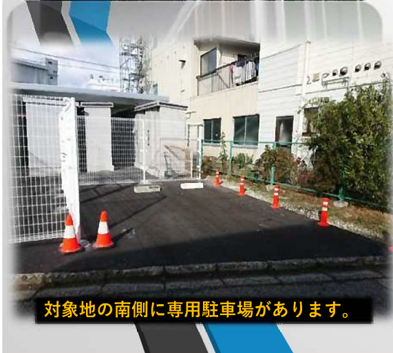
対象地の南側に専用駐車場があります。