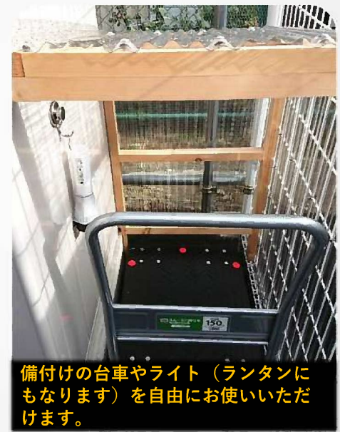
備付けの台車やライト（ランタンにもなります）を自由にお使いいただけます。