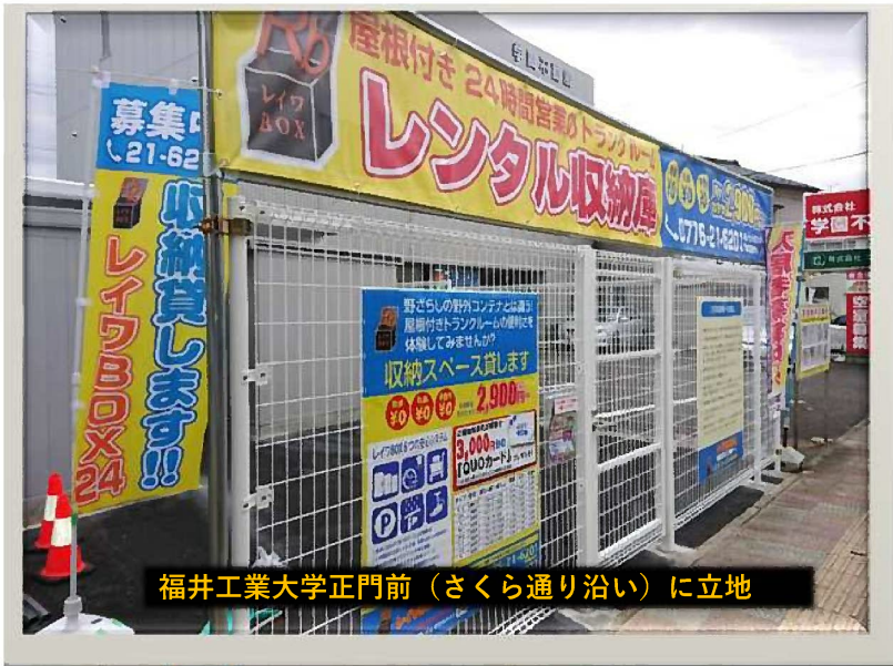
福井工業大学正門前（さくら通り沿い）に立地